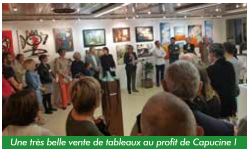
Une très belle vente de tableaux au profit de Capucine !

Du 29 octobre au 13 novembre 2022, l'exposition annuelle d'Artistes pour l'Espoir Chantonay réunissant 22 peintres et sculpteurs reconnus soutenait, cette année, les associations