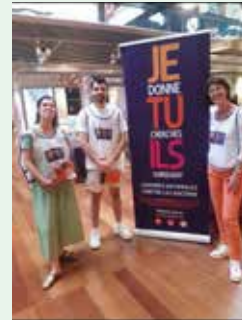
Action de sensibilisation à Euralille

Plusieurs informations sur le DVMO 1 ont été faites ou sont prévues :