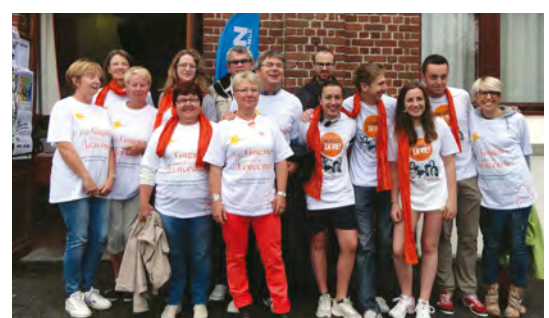
Une bonne partie de l'équipe qui a participé aux Foulées

Bilan de l'opération : 689 participants, 100 bénévoles et un beau chèque de soutien remis à l'Association. Le tout dans une ambiance très sportive, avec un peu de soleil et beaucoup de bonne humeur.