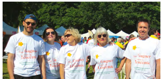
Avant le départ, cinq des six participants

Une fois ce premier obstacle franchi, reste à chausser les baskets pour s'entraîner. Au programme : 6 km de course ou de marche rapide au cœur du Parc de St Cloud. Avec un objectif : gagner bien sûr, mais aussi vivre un grand moment d'échange, de rencontres, de solidarité, dans une ambiance joyeuse et dynamique. Résultat des courses : tous nos héros ont franchi la ligne d'arrivée et l'Association a récolté une très belle somme qui sera reversée à la Recherche. Rendez-vous est déjà pris pour 2015, avec, nous l'espérons, encore plus de coureurs !