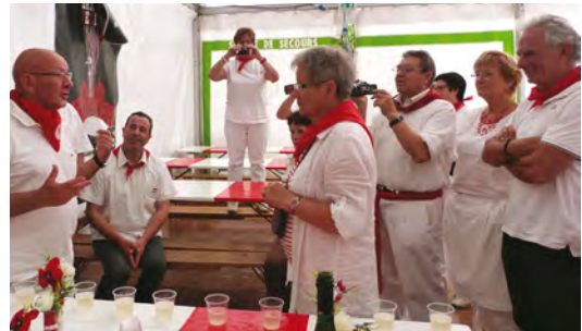
Remise de chèque aux Fêtes de Dax, en tenue de Féria bien entendu !

Conférences publiques à Ajaccio et Bastia.