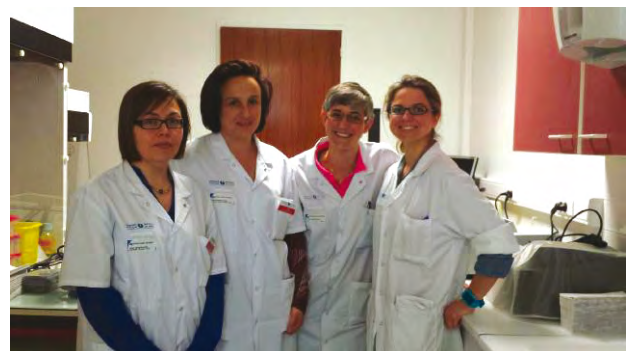
L'équipe qui travaille sur le projet