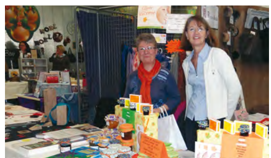
Un des nombreux stands de l'équipe de Lille et ses deux animatrices, à Beaucamps-Ligny, avec les fameuses confitures maison...

Si vous souhaitez retrouver tous nos sponsors ou avoir des informations sur nos événements à venir en 2014/2015, rendez-vous sur notre site internet : www.capucine.org