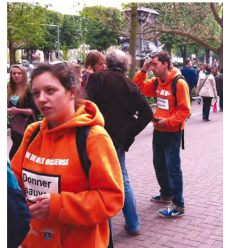
Des jeunes très efficaces pour convaincre d'autres jeunes, et aussi de moins jeunes...