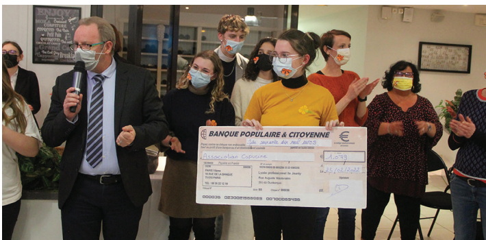
Remise d'un chèque de plus de mille euros par les élèves !

Un grand merci à ces élèves au grand cœur, à leurs professeurs et à l'équipe éducative qui les ont accompagnés dans cette action.