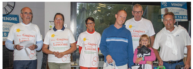
La remise des prix suivie d'un cocktail concocté par le Bistrot du Golf grâce à la générosité des entreprises Algimouss, AtlantiC Ingénierie, Cinq Mondes, Goldy's, IAD, Tandem et UltimateFishing