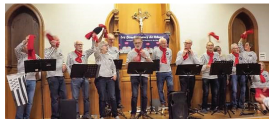
« Les Bourlingueurs » en pleine action !