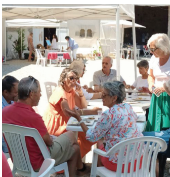
Grand barbecue amical avec une vente dans les bâtiments

Le 9 août 2022 a eu lieu une grande journée de vente suivie d'un barbecue pour l'antenne vendéenne aux Clouzeaux.