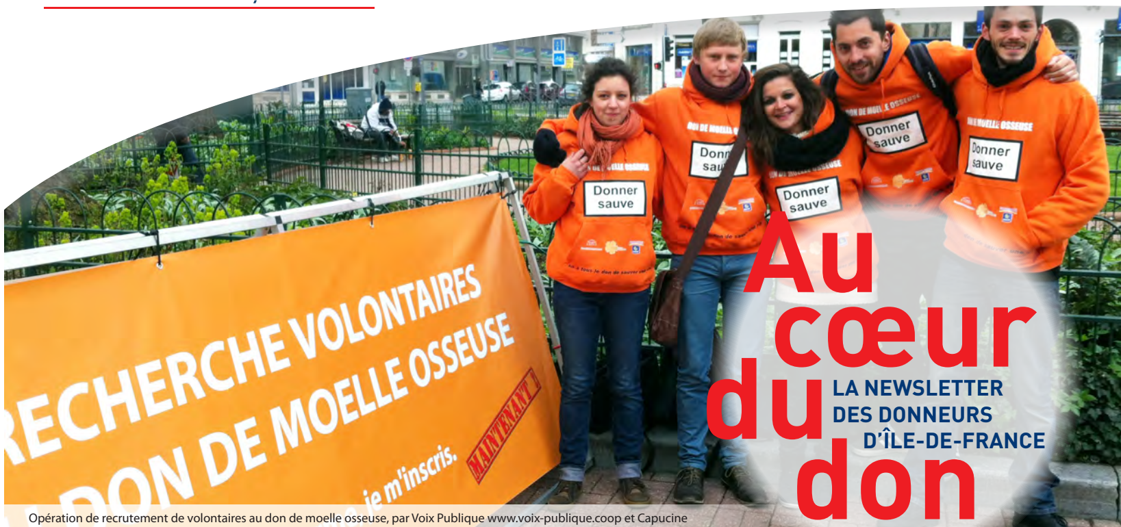
Opération de recrutement de volontaires au don de moelle osseuse, par Voix Publique www.voix-publique.coop et Capucine