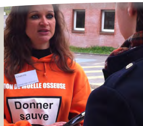
Recrutement face-à-face réalisé par Voix Publique www.voix-publique.coop et Capucine

B.E. : « Pour créer une dynamique, il n'y a rien de mieux que de faire porter le message par les jeunes eux-mêmes et d'aller à la rencontre de la population. C'est pourquoi, nous avons apporté notre soutien au printemps dernier