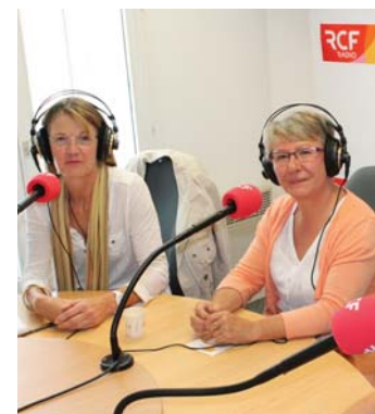
L'équipe lilloise en pleine interview sur RCF