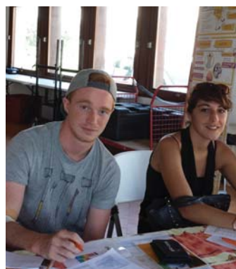
Jeunes estivants heureux de remplir leur fiche de pré-inscription sur le registre de DVMO lors de la collecte de sang de Vieux-Boucau (40) le 3 août

Participation à la 10ème semaine nationale au Don Volontaire de Moelle Osseuse et à la Journée mondiale du don de sang, intervention lors d'une conférence sur le don d'organes organisée par ILIS (Institut Lillois d'Ingénierie de la Santé), organisation d'une réunion publique à Roncq, participation à un flashmob place de l'Opéra à Lille, soirée d'information à l'ICES à la Roche sur Yon.