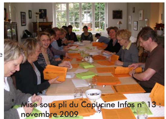
Mise sous pli du Capucine Infos n° 13 : novembre 2009