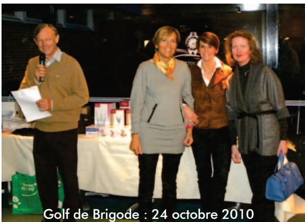
Golf de Brigode : 24 octobre 2010